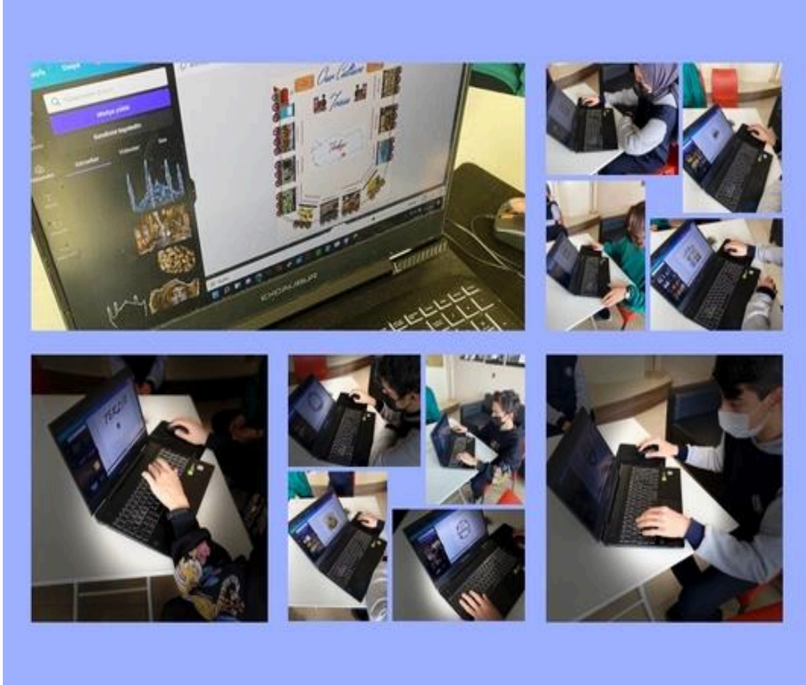
2.Ay etkinlikleri: Güvenli internet Günü Etkinlikleri ve Kodlama